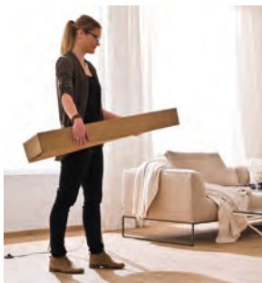
Praktisches Format (25 x 100 cm)