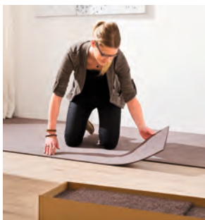
Leicht verlegbar und kreativ kombinierbar